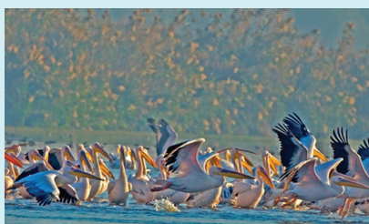
שקנאים באגמון החולה