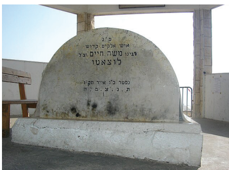
אנדרטה לזכר חללי מלחמת ששת הימים