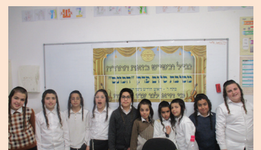
סיום פרק הכנס, כיתה ו'

עקר התחברות ודבקות להשם יתברך הוא ע"י תפלה