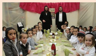
סדר ליל הסדר