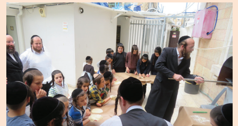
אפיית מצות בתלמוד תורה