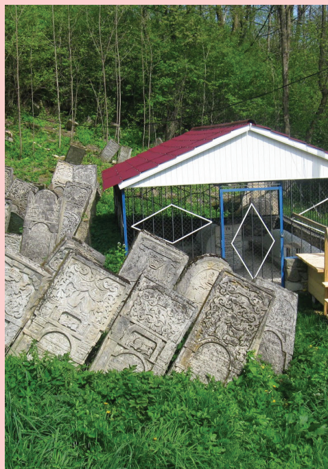
ציון רבי חיים מקוסוב וצאצאיו

רבינו ה'תורת חיים' היה מהצדיקים הגנוזים, הנהגתו היתה פשוטה ביותר כלפי חוץ, פעמים שראוהו לבוש בלבוש קצר חגור בחבל כפרי, מאכיל את הסוסים התרנגולים והברווזים שבחצרו. אך צדיקי דורו ראו בעינים הזכה שמדובר באחד מצדיקי הדור.