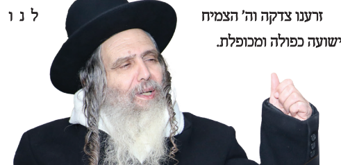
זרענו צדקה וה' הצמיח ישועה כפולה ומכופלת.

עברו חודשים מספר ולאחריו זכינו לבשורה כי בקרוב תבוא הישועה. והנס לא אחר לבוא כעבור פחות משנתיים ימים זכינו לחבוק זוג תאומות קטנות וחמודות במתנת חינם מבורא עולמים וללא שום רפואות וטיפולים.