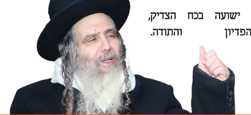
ישועה בכח הצדיק, הפדיון והתודה.

באותו היום בו עשיתי את הפדיון, התקשרו אליי להציע לי שידוך, נפגשתי עם הבחור כמה פעמים וראיתי שזה ממש "ענבי הגפן בענבי הגפן". מדהים, ביום שעשיתי את הפדיון התארסנו.