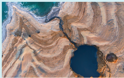
כך נראה בולען בים המלח