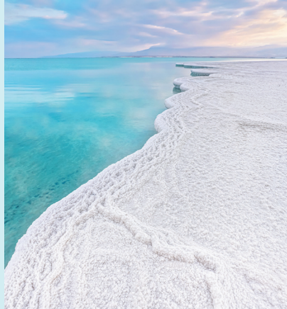
הצטברות גבישי מלח בים המלח

זהירות! בולענים- הבולענים הם בורות גדולים מאוד, שהקוטר והעומק שלהם עשויים להגיע אף ל-30 מטרים! הם נפערים באופן שנראה פתאומי, אולם לקריסת האדמה קודמים תהליכים ממושכים בשכבות התת-קרקעיות, הקשורים בירידה של מפלס המים באגן הצפוני של ים המלח.