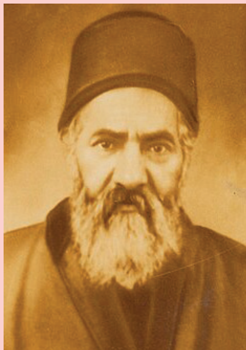
רבנו בעל "כף החיים"

לרבי יעקב חיים הייתה אהבה וחיבה גדולה לארץ ישראל וכך זכה בשנת תרס"ד, לאחר קשיים, נדודים ותלאות גדולים. בשל חכמת אלקים אשר פיעמה בקרבנו ובשל מידותיו התרומיות נשא חן וחסד בעיני כל רואיו והצטרף לחבר החסידים בבית המדרש "בית אל" אשר בעיר העתיקה בירושלים. הוא החל להתפלל בקדושה וטהרה על פי כוונות האר"י ז"ל ועל פי כוונות הרש"ש זיע"א. רבי יעקב התמיד ועלה מעלה מעלה במעלות הקודש מתוך עוני ודלות.