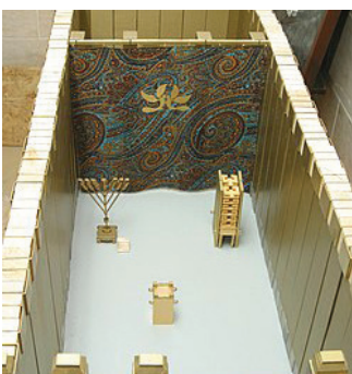
אֵלֶּיךָ יְיָ אֱלֹהֵינוּ וְנִשְׁכַּח לְפָנֶיךָ יְיָ אֱלֹהֵינוּ