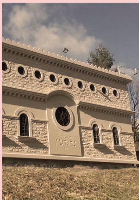
ציון הסבא קדישא מראדושיץ זיע"א

לאחר פטירת הרה"ק רבי ישעיה מפשדורב זי"ע, הפצירו