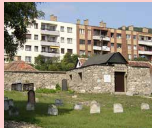
אוהעל-בית החיים הישן

עצומה, אמרותיו הטהורות חדרו אל עומקי ליבות השומעים והבכיות גברו עד לב השמים. כיון שהרגיש הישמח משה שכל השומעים שבו בתשובה שלימה מעומק הלב, זעק ואמר: 'איתא בזוה"ק (זוהר חדש פרשת נח) שאפילו אם רק בית המדרש אחד שבים בתשובה שלימה אפשר להביא את הגאולה, הבה נישבע שאיננו עוברים את בית המדרש עד שיבוא מלך המשיח לגאלינו, בהתלהבות עצומה עמדו כולם להשבע, לפתע נשמעו קולות ורצפת עזרת הנשים התחיל להשבר, בהלה עצומה נפלה במקום וברחו כולם מבית המדרש, והבינו שמעשה שטן הוא זה שביקש למנוע את ביאת המשיח ובעוה"ר עלה בידו. אך על כל פנים חזינו מכאן את כוחו הגדול של רבינו בדרשותיו, עד שכמעט הצליח לפעול את ביאת המשיח.