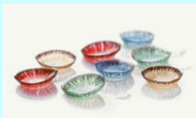
למי שרוצה לגנון...