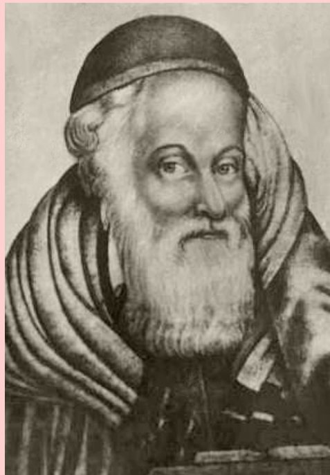
רבי משה טייטלבוים ז"ע