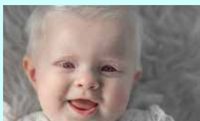
לבקן עם עיניים וורדרדות