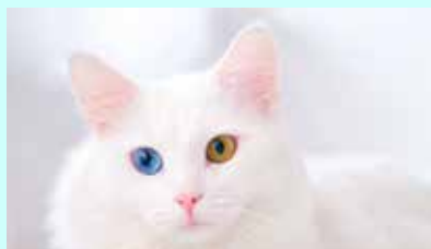
"הטרורכומיה" - צבע קשתית שונה

צבע עיניים אינו משפיע על איכות הראייה, אך כן משפיע על מידת הסינוור באור עז.