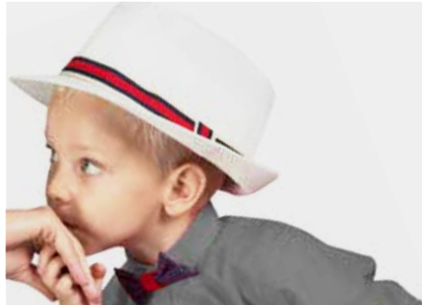
שבת שוב הגיעה, כמה נפלא!

רבי יצחק יוסף בספרו ילקוט יוסף כותב (שבת כ"א, ח"ג, סימן רע"א פרק ט"ו סעיף קל"ג): "אחר הקידוש בליל שבת הילדים נוהגים לנשק ידי אביהם ואמם. על פי הסוד יש לנשק ידי אמו בליל שבת ועא"פ כן ינשק ידי אביו תחילה."