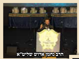
הרב נחמן ארוש שליט"א