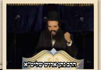
התהפוך צאהוש שליט"א