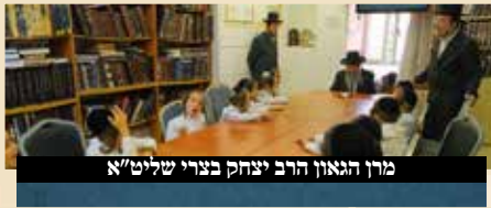
מרן הגאון הרב יצחק בצרי שליט"א