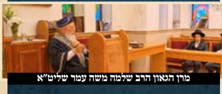
מרן הגאון הרב שלמה משה עמר שליט"א