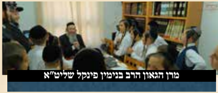
מרן הגאון הרב בנימין פינקל שליט"א