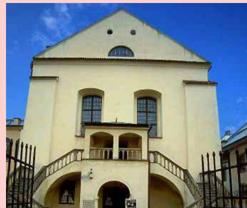
בית הכנסת אייזיק בקראקא

ועלינו לענות. אנחנו גיחוי ושלושתי בנינו... - ומי הם שני האנשים שרצתם אחריהם? - שאל הב"ח. - הם אליהו הנביא ואלישע. אחד מהעונשים שלנו הוא, שאנחנו תמיד רצים אחרי אלישע, אבל איננו מסוגלים להשיג אותו. - ולאן הלכו עתה השניים? - הוסיף הב"ח לשאול. - הם הלכו לבעל ה"מגלה עמוקות", ענו. הלך הב"ח ל"מגלה עמוקות" ואמר לו: יודע אני כי אליהו נמצא אצלך, תשאל אותו למה איננו בא אלי?