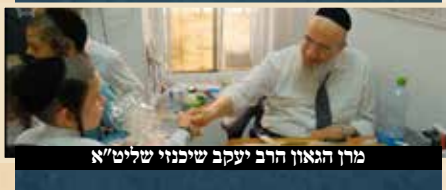
מרן הגאון הרב יעקב שיכנזי שליט"א