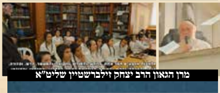
מרן הגאון הרב יצחק זילברשטיין שליט"א