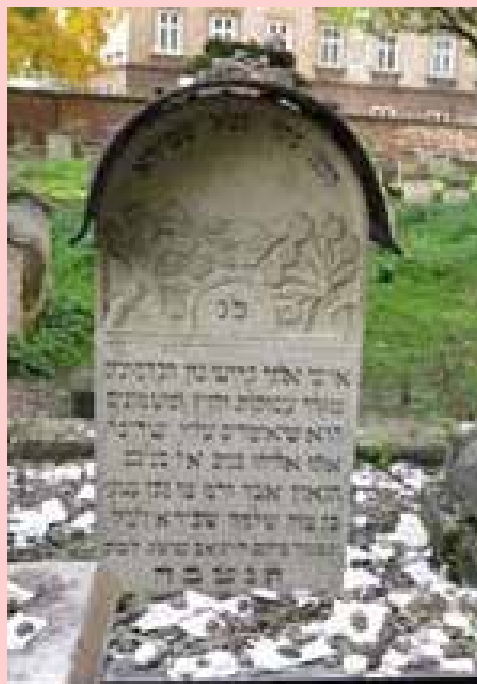
קבר המגלה עמוקות זיע"א

אלה תולדות איש האלוהים רבי נתן נטע זיע"א, נולד בשנת ה'שמ"ה לאביו הגא"צ ר' שלמה שפירא גאב"ד הורדנא ז"ל (מחבר ספר מבוא השערים על הס' שערי דורא וס' אמרי שפר עה"ת) וחתן הגה"צ ר' משה יעקילס (אחיו של ר' אייזיק יעקילס מקראקא אשר עליו משייכים את הסיפור של האוצר מתחת לגשר, ביה"כ אייזיק בקראקא הנקרא הנקרא על שמו ושוכן ביזפיו עד היום נבנה מכספי אוצר זה) נתגדל על ברכי התורה הכתובה והמסורה, וייעש חיל בכל פינותיהם והיה לו בקיאות עצומה בחכמת הנסתר וידע את כל ספרי הזוהר והתיקונים וספרי האר"י בע"פ ושאר ספרי המקובלים הקדמונים והאחרונים כולם פתוחים היו לפניו לא נגרע ממנו דבר, והיה יודע הכל בע"פ, כאשר גם ספרי הפוסקים הראשונים והאחרונים ותלמוד בבלי וירושלמי את הכל ידע בעל פה.