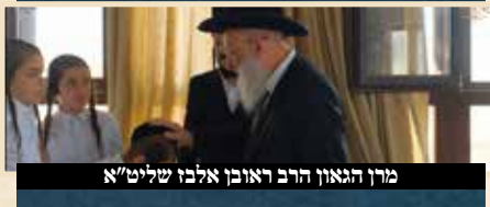
מרן הגאון הרב ראובן אלבו שליט"א