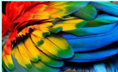
נוצות צבעוניות של תוכי