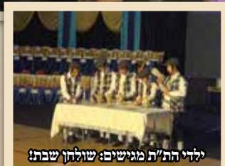
ילדי הת"ת מוגישים: שולחן שבת!