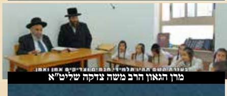
מרן הגאון הרב משה צדקה שליט"א