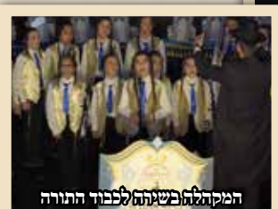
המקהלה בפשתה לכבוד התורה