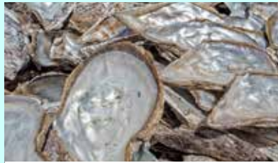
מפעל לייצור פנינים מלאכותיות

נדיר למצוא פנינים בצדפות שנשלחו מהים או מאגמים. ולכן, רבים "מגדלים" פנינים מתורבתות. אלו נוצרות ע"י הכנסת גורם זר בצורה מלאכותית לתוך הצדפות, וגיזולם בצורה מבוקרת במשך שבועיים, לאחר מכן הצדפות עוברות לרשת במי ים ונמצאות שם בהשגחה מלאה במשך שנתיים וחצי עד שהפנינה מתגבשת. אחוז ההצלחה מגיע לכ-50%, אך רק כחמישית מתאימים לשיבוץ בתכשיטים או כאבן חן.