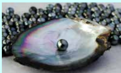
'פנינות טהיטו' - השחורות יקרות מאד