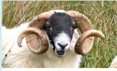
איל עם קרניים

רוב השופרות עשויים מקרני איל, כבש בוגר ממין זכר משום שבשיראל אין אילים שקרניהם מתאימות לשופרות, מיובאות הקרניים ממדינות המגרב ודרום אפריקה. את השופר ה"תימני" מכינים מקרני קודו גמלוני. איילי הצפון שהקרן שלהם עשויה כולה עצם לא יכולה לשמש כשופר