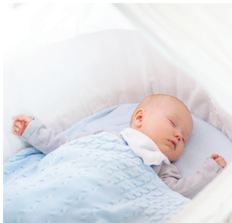
לרופא בעל שם עולמי, מומחה גדול בתחום, ולשאול בעצתו אולי ימצא מזור למכאובם.

ואכן כך היה, לתקופת השנה ההורים נענו ונולד להם בנם יקירם, הלא הוא מרן הגאון רבי יוסף שלום אלישיב זצ"ל, שהאיר את העולם בתורתו.