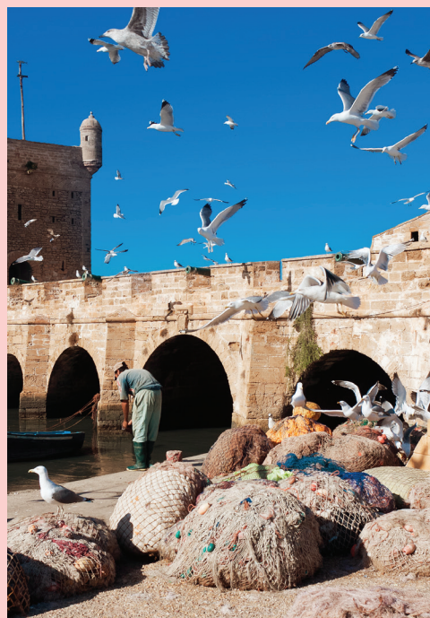
העיר מוגדור, כיום אסאווריה