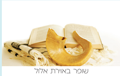
שופר באורת אלול

מהו בעצם השופר? השופר זהו עצם שיוצאת מהגולגולת של החיה לחלק הזהו קוראים הזכרות. והקרן היא מעין עטיפה שצומחת יחד עם העצם של החיה זה הנקבות.