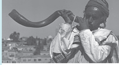
תוקע בשופר תימני

כאשר מוציאים את העצם מתקבלת קרן שהחלק הרחב שלה חלול והחלק הצר שזה השליש העליון של הקרן הוא מלא. הקרן עוברת חיטוי יסודי, בשלב הבא מיישרים את השליש הצר של הקרן שעשוי חומר מלא כדי לקדוח אותו ולהגיע לחלל של הקרן. היישור מתבצע על ידי חימום הקרן עד שהיא מתרככת ואז בעזרת מכש מיישרים את הסלסול שלה ומניחים לה להתקרר.