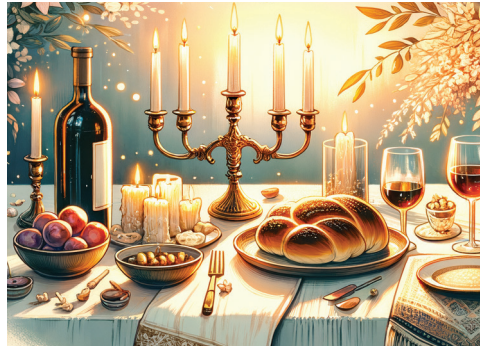
"שבת שלום". גוט שאבע'ס" נשמעת הברכה מכל עבר.

ידידים, מכרים אורחים ואבא שחזור מבית הכנסת מאחל בלבביות "שבת שלום".