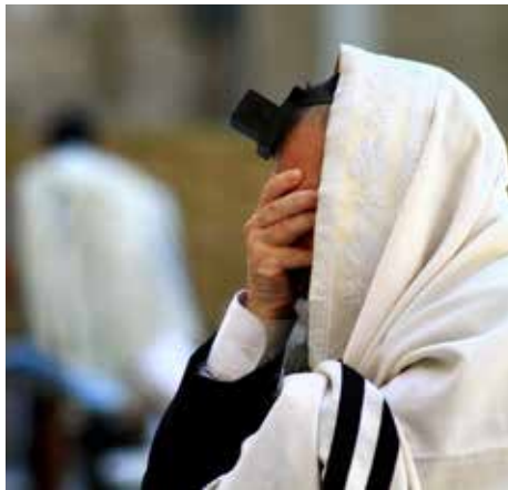
אוזניו כרויות למוצא פיו ולא עסוקות בדברים אחרים.

(משנ"ב שם סק"ה). הנה מדברים אלו יש ללמוד שאין להגביה את הקול בתפילה. ולכאורה זה סותר למה שנתבאר כאן בתורה.