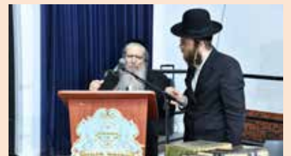
מורינו מברך את חתני השמחה

"אם היו בני אדם מרגישים במתיקות ועריבות טוב התורה, היו משתגעים ומתלהטים אחריה, ולא יחשב בעיניהם מלא עולם כסף וזהב למאומה, כי התורה כוללת כל הטובות שבעולם"