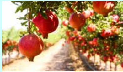
פרדס עצי רימונים

רימון, שנהיה מלאים מצוות כמוהו זה לא הכל- הרימון עשיר בויטמינים ומינרלים את הפרי הזה מומלץ לצרוך מדי יום ולא רק בראש השנה, הוא פרי שבונה את הגוף ומגן עליו. גם ברפואה האלטרנטיבית מייחסים לפרי הזה סגולות כך למשל הוא נחשב כמסייע לריפוי פצעים, לטיפול בקמטי עור ועוד.