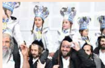
חתני השמחה בריקודים