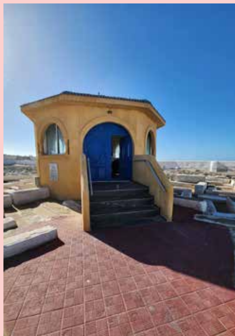
קבר רבי חיים פינטו במוגאדור

בזמן המלחמה יצא הצדיק מביתו, והנה אחד הגויים חמוש בחרב רצה לפגוע בצדיק וראה זה פלא היד התייבשה והגוי לא