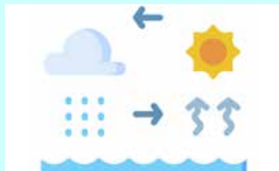
שרטוט מחזור המים בטבע