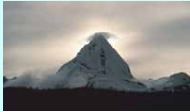
ענן על הר

הקור שבגבהי האטמוספירה הוא שגרם לאדי המים להתעבות ולהפוך שוב לטיפות מים, המוני טיפות כאלה עתידות להיצמד זה לזה ולהפוך לעננים. ואיך הענן הופך לגשם? אדי המים שבאוויר צריכים להפוך לטיפות מים קטנות או לגבישי קרח קטנים. כדי שזה יקרה, הם צריכים "מקום להתפס". זה יכול להיות חלקיקים קטנטנים של אבק או אבקנים שנמצאים באוויר. תחשבו על זה כמו כשיש כוס עם שתייה קרה, והמים שבאוויר נדבקים לכוס מבחוץ – אותו הדבר קורה בעננים! אחרי שטיפות המים נוצרות בענן, הן מתנגשות והופכות לגדולות יותר. טיפה גדולה ונופלת למטה בתור גשם, אם הטיפה יורדת דרך אוויר קר מאוד, היא יכולה לקפוא ולהפוך לברד, או שאם הענן קר מאוד, היא תישאר גביש קרח ותהפוך לשלג.