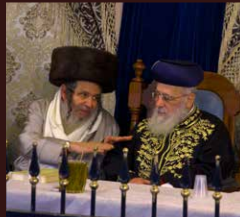
הרב יצחק יוסף שליט"א במעמד ההילולא