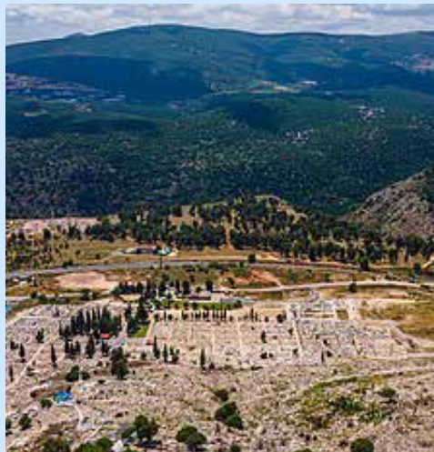
בית העלמין העתיק צפת

מסורת אחת מספרת כי את הייסורים קיבל על עצמו בשל שדיבר סרה ברבי נחמן מברסלב (קובץ הערות