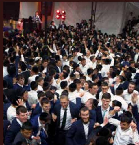
קהל המשתתפים בהילולא