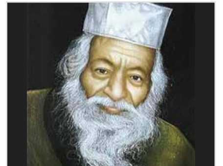
אוריאל, אוריאל, אוריאל