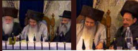
רבנים ואדמו"רים במעמד ההילולא