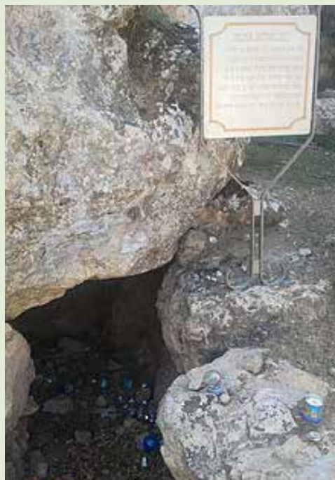
מערת קברו בבית העלמין בחברון

בהגיעו לעיר עזה המגיפה נעצרה ור' אברהם החל לחבר את ספריו "בעלי ברית אברהם" ו"חסד לאברהם" כהודאה להש"ת שהצילו ועשה עמו חסד.