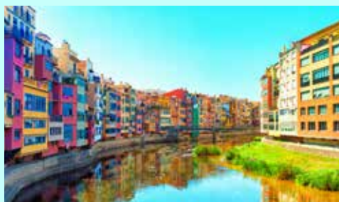
גירונה עיר הולדתו, כיום.

הוא החליט לעלות על קברו של הרמב"ם במניין עשרה ולבכות על קברו שבעה ימים כדי לבקש מחילה. בפה מלא התחרט ואמר: "הנני מכה על פני ובוש ומתחרט על אשר פערתי פי נגד רבנו הקדוש הרב משה בן מימון וספריו, והנני מודה מלב ומנפש