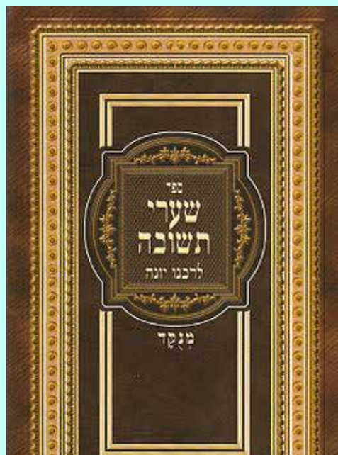
ספרו הידוע "שערי תשובה"

נפטר בטולדו בכ"ח בחשוון בשנת ה' אלפים כד'. ספריו פירוש על הרי"ף מסכת ברכות "עליות דרבנו יונה" על מסכת בבא בתרא. פירוש על ספר משלי פירוש על מסכת אבות שערי תשובה - ביאור והרחבה בנושאי תשובה ספר היראה - ספר מוסר. יהי רצון שנזכה ללכת בדרכיו הקדושים ונזכה שזכותו תהא מגן וצינה עלנו אכי"ר