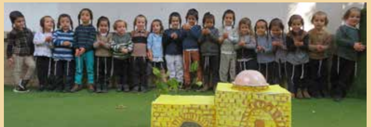
הילולת רחל אימנו