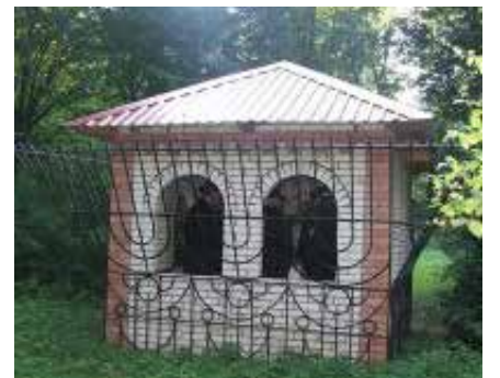
מגן דוד, אגודת ישראל