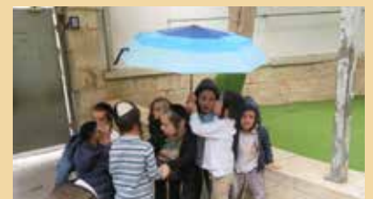
ז' חשוון- תן טל ומטר