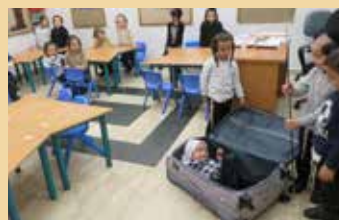
לך- לך שרה אימנו בתיבה