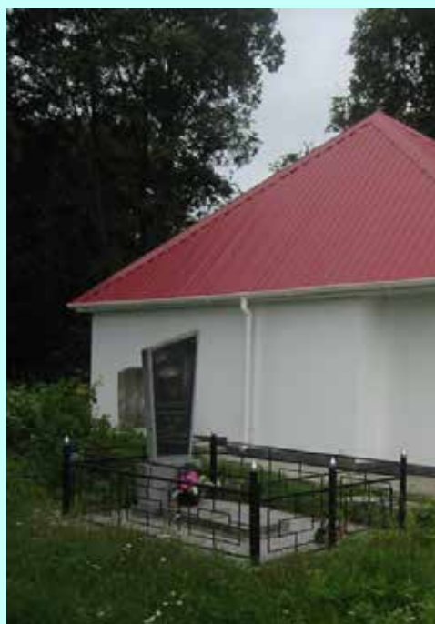
אוהל האדמו"ר האמצעי בניעז"ן

כאשר פרצה מלחמת רוסיה-צרפת ועקב הלשנות של מתנגדי החסידות נאלץ אביו האדמו"ר הזקן לברוח יחד עם משפחתו מליאדי, וזמן קצר לאחר-