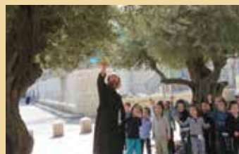
פר' נח- היונה ועלה זית בפיא