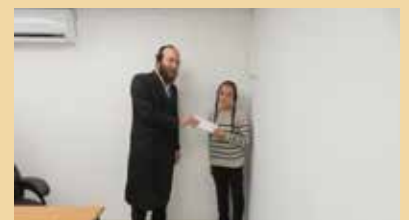
פרסי עידוד לנבחני פרקי משניות