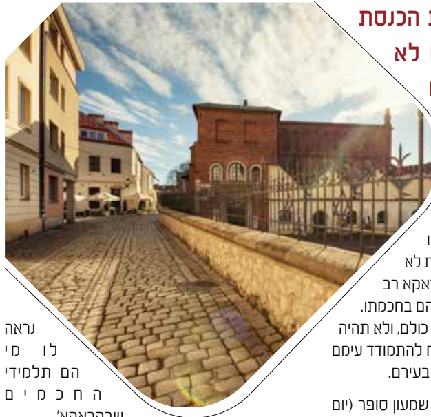
נראה לומר כי הם תלמידי החכמים שבקראקא...

"ביום המיועד נמלא בית הכנסת מפה לפה. אחרי שנים לא מעטות בהן לא הסכים אף מועמד ליטול סיכון שיתבזה ברבים מול כל אנשי העיר"