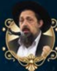
מח"ס האון הצדיק רבי אהרן יצחק שטון שליט"א דב תמוז