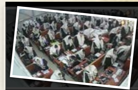
בית הכנסת ובית המדרש "זיו יהודה"