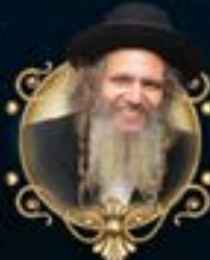
מנן רבי שלום ארוש שליט"א נשא תמוז חזק של חסד